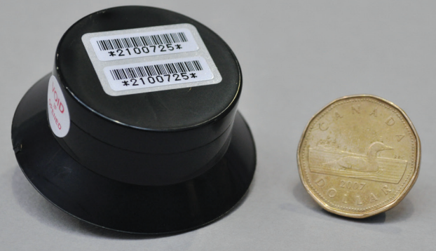
Détecteur de radon alpha passif. Disponible à l'APQ.