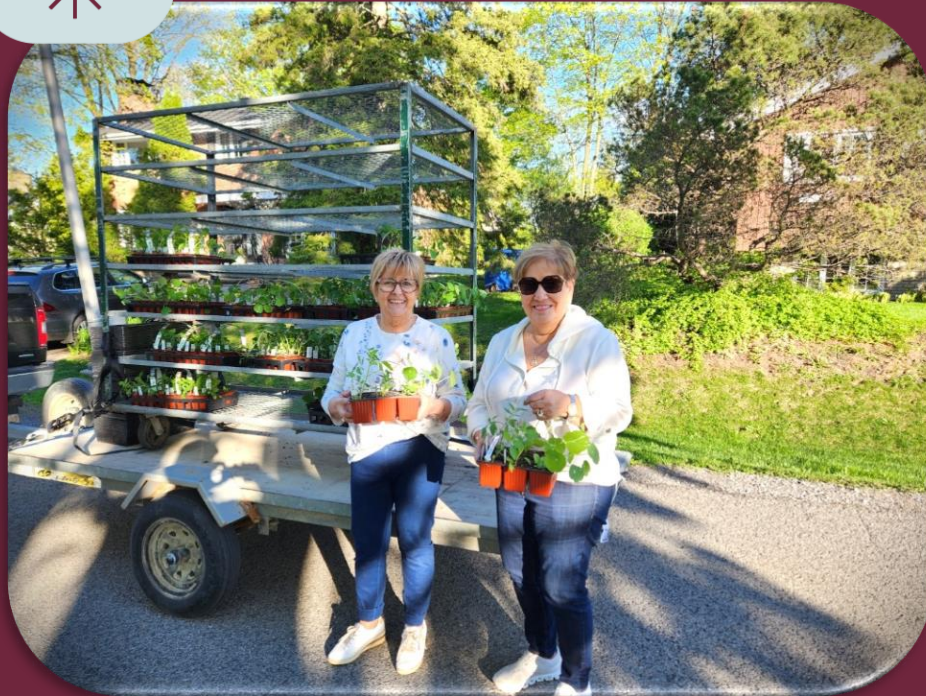
Distribution de cassettes, Lorraine, 10 mai 2024.