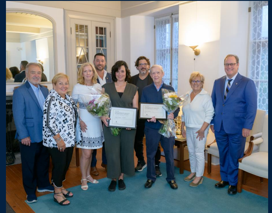
Coup de cœur du public, Lorraine, 20 août, 2024.