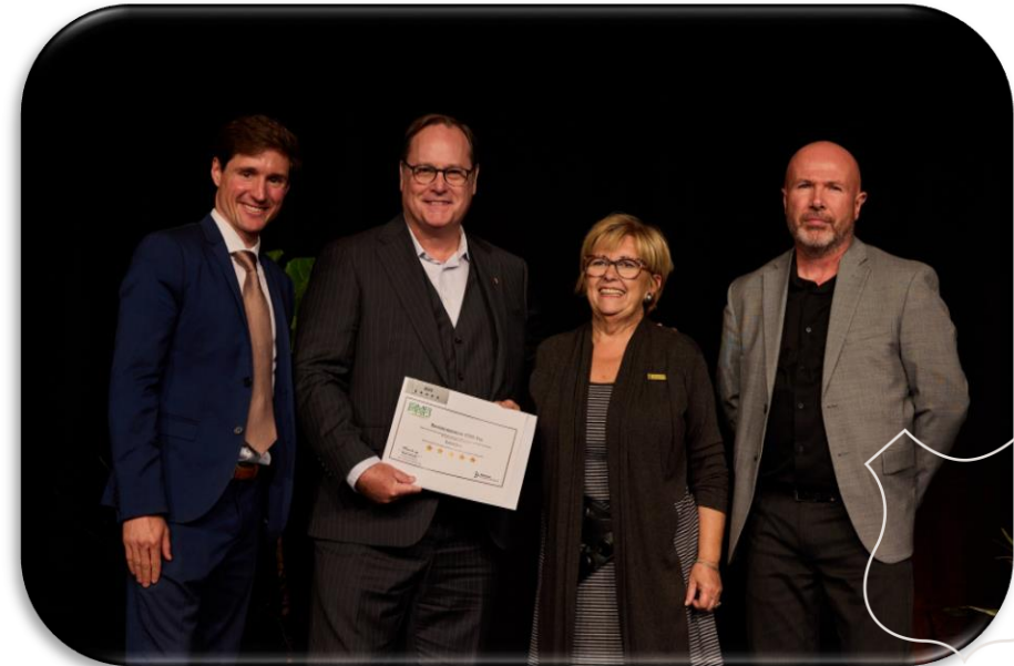
Cérémonie GMR Pro, Drummondville, 17 octobre 2024