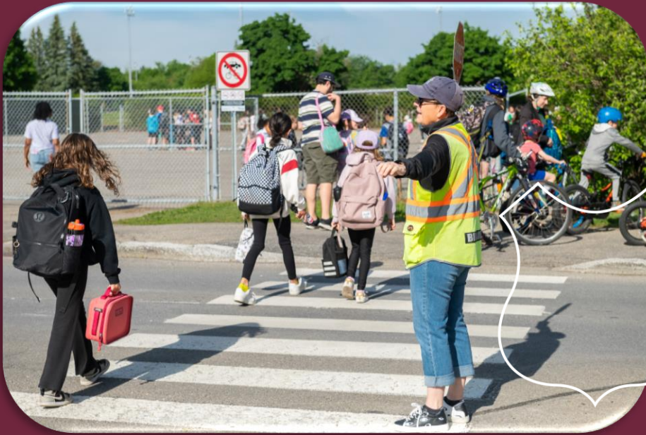
Brigadière à la rentrée, Lorraine, 30 août 2024.