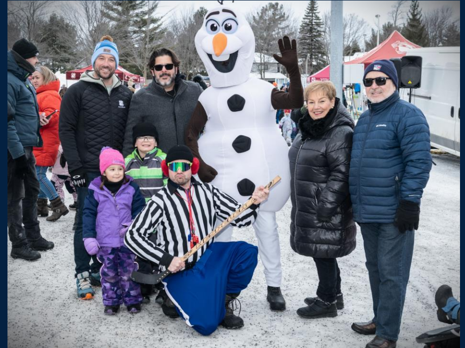
Fête des neiges, Lorraine, 3 février 2024.